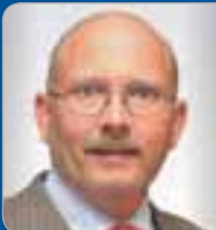
RR ADir. Flucka Teamleiter Zollamt Wien