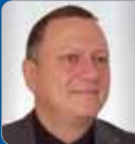
Mag. Perz Stv. Abteilungs- leiter Produk- sicherheit Sozialministerium