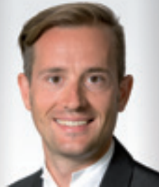
RA Dr. SELING, M.B.L. DORDA Rechtsanwältin GmbH