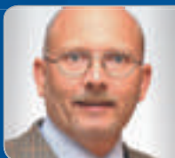
RR ADiR. Flucka Teamleiter Zollamt Wien