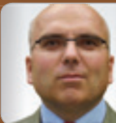
StB Mag. Portele Experte f. Immo- biliensteuern Selbstständiger Steuerberater