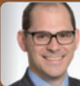
RA Mag. Richter Experte f. Miet- und Immobilien- recht Dorda RAe GmbH