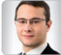
RA Mag. Tlapak, LL.M. IT/IP & Daten- schutz-Desk Dorda Rechts- anwälte GmbH