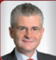
RA Mag. Brogyányi Partner Dorda Rechts- anwälte GmbH