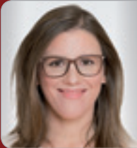
RA Dr. Körber-Risak Arbeitsrechts- expertin KÖRBER-RISAK RA GmbH