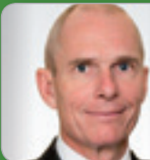
RA Dr. Frotz Experte f. Unternehmens- & Gesellschaftsrecht Frotz RAe OG