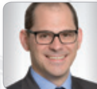
RA Mag. Richter Rechtsanwalt DORDA Rechts- anwälte GmbH