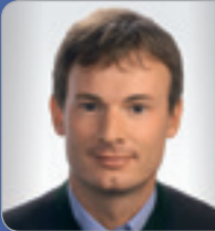
DDI Mag. Schmied IT-Ziviltechniker Allgem. beeid. & gerichtl. zert. SV